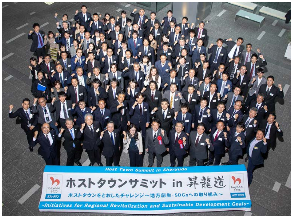
(ホストタウンサミット in 昇龍道 2019年12月)