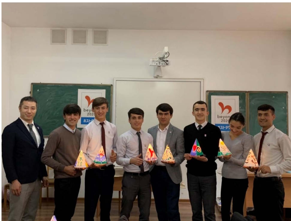
(青森市とタジキスタンのねぶた交流 2019年11月)